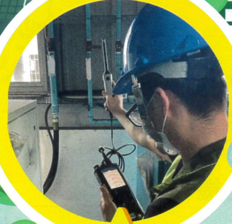
設備機房溫度檢測