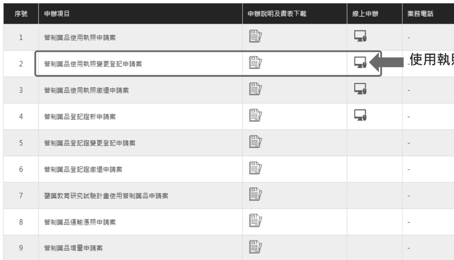
線上申辦項目表單